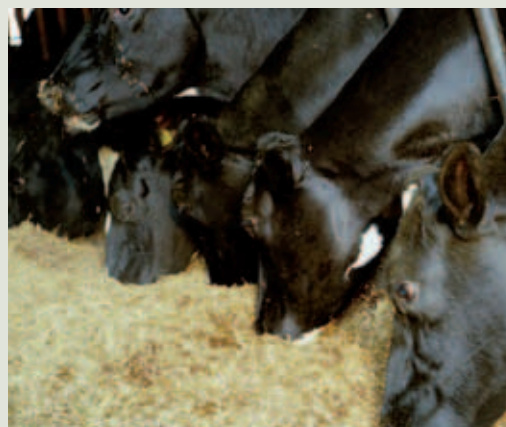
Average Milk Yield During First 17-Weeks of Lactation

Nedávná studie na univerzitě v Readingu (UK) zaznamenala zvýšení průměrné dojivosti o 4,3 litru/den od otelení do 120 dnů laktace při zkmování Megalacu.